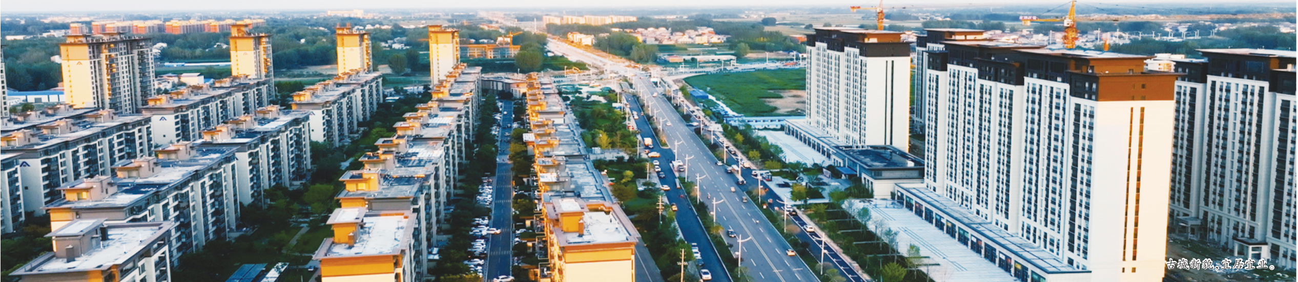
古城新貌,宜居宜业

聚力防范风险守底线,巩固和谐稳定新常态。 安全生产治本攻坚三年行动深入推进,全县安全生产形势总体平稳。法治西华建设纵深推进,“八五”普法圆满收官。平安建设成效显著,民生案件、刑事案件破案率均位居全市第一。在全市生态环境保护工作综合评价中,西华位居第二。在全市安全生产工作综合评价中,西华位居第三。