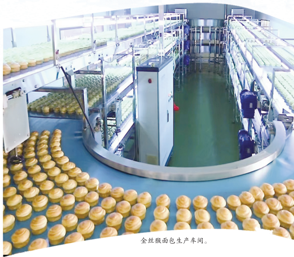
金丝猴面包生产车间。

2022年至今,沈丘县拥有国家级专精特新“小巨人”企业1家、高新技术企业44家、省级“瞪羚企业”4家、专精特新企业17家、智能工厂1家、绿色工厂2家、省级制造业数字化转型示范企业1家,为经济社会高质量发展筑牢了根基。