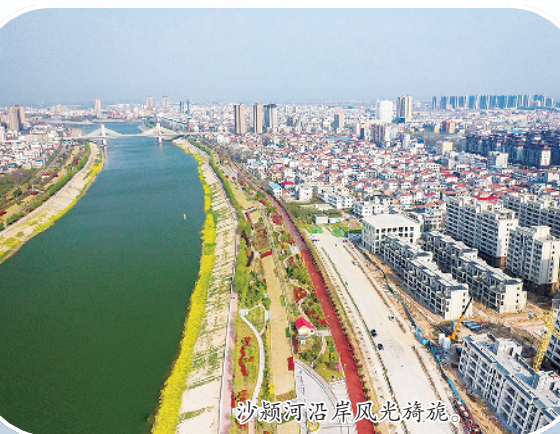
沙颍河畔风光如画。