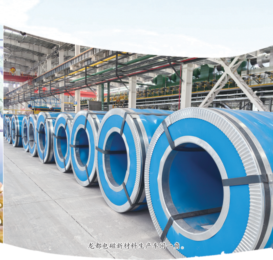
龙都电磁新材料生产车间一角。