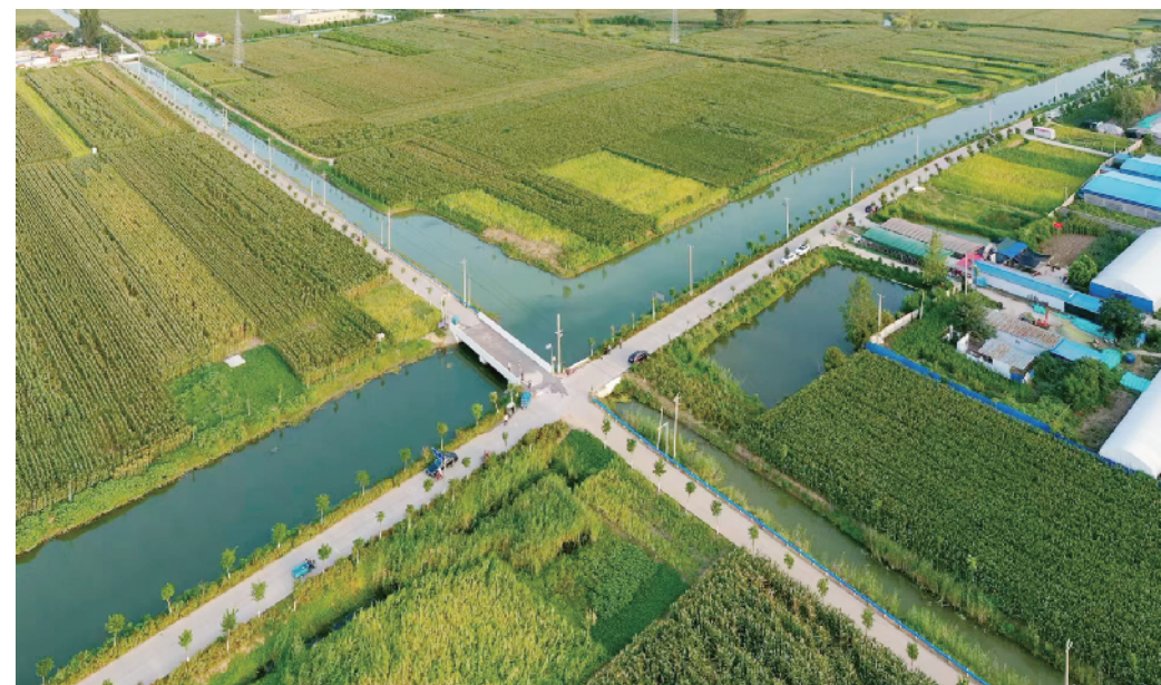
纵横交错的水田网。

经济总量从2021年全市第四位跃升至2023年全市第二位;2024年稳居全市第二位,位居全省103个县市(不含区)第28位。一般公共预算收入2023年首次突破20亿元,2024年达到20.46亿元;2022年至今,一般公共预算支出连续3年居全市第一。2024年达到69.3亿元,2025年前6个月,全县地区生产总值完成194亿元,同比增长7.9%,增速居全市第三。