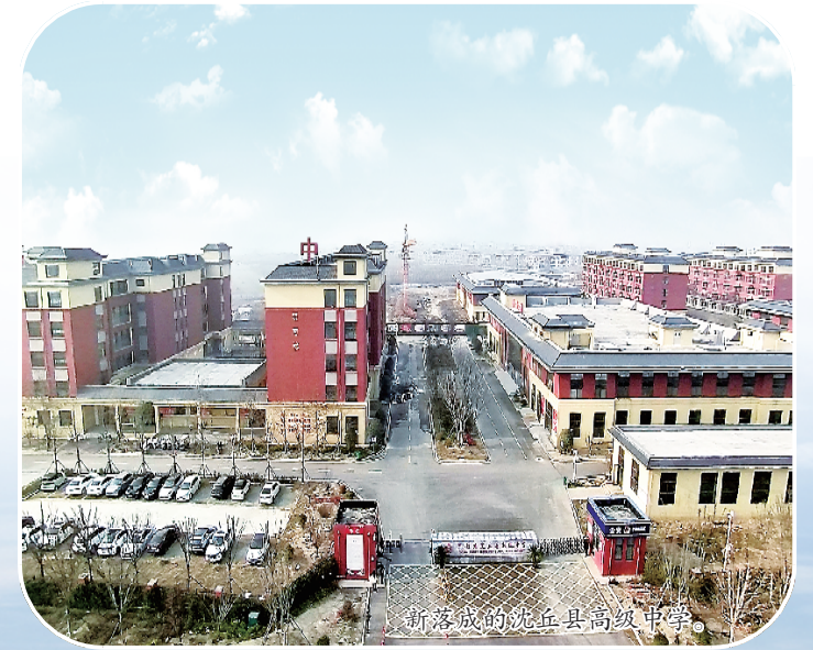
新落成的沈丘县高级中学。

回眸“十四五”,沈丘县委、县政府面对严峻复杂的经济形势,锚定目标不放松,以实干在党建引领基层高效能治理、产业发展、乡村振兴等经济社会发展各领域书写了浓墨重彩的篇章。展望“十五五”,在新的历史征程上,沈丘县委、县政府将带领全县广大干部群众落实二十届四中全会精神,聚焦“两高四着力”,锚定“1+2+4+N”目标任务体系,落实市委“16232”总体工作思路,持续抓好“四件大事”不动摇,以更加昂扬的姿态,踔厉奋发、砥砺前行,用坚毅和汗水绘就更加辉煌的新画卷,为奋力谱写中原大地推进中国式现代化周口新篇章贡献沈丘力量。