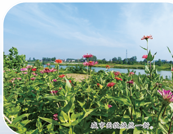
沈丘县钢铁新城一角。

创新开展沈丘中心城区“路长责任制”工作,常态化落实三级“路长责任制”,围绕地面、墙面、侧面、上面“四面”,抓好治堵、治脏、治乱、治污“四治”和上改下、白改黑、抓后改、赤改文“四改”工作。实施城市路网改造、广告牌匾整治等“二十项工程”,并在沈丘中心城区“一镇两办”开展“清洁家园”行动,在全域开展“爱护母亲河”等行动,城市整体形象显著提升。